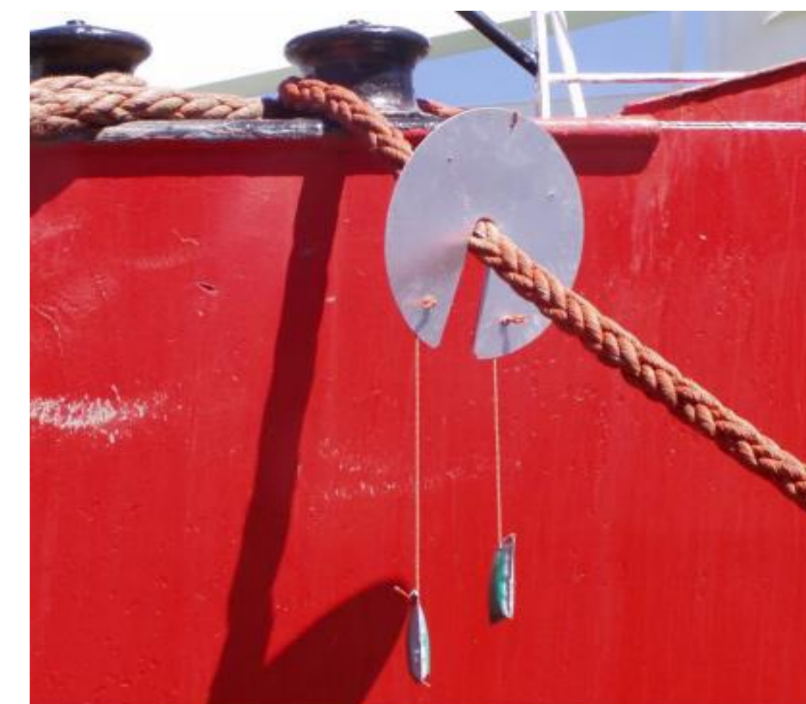
Esempio di sistema di protezione da installare sulle cime.

Attivazione di un sistema di intercettazione in punti strategici nei due porti dell'isola. Utilizzo nelle imbarcazioni che attraccano a Linosa di sistemi per impedire la salita e la discesa dei ratti.