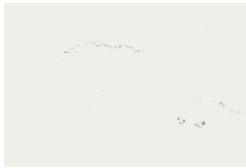
Gerlando Sorrentino, 2ª media