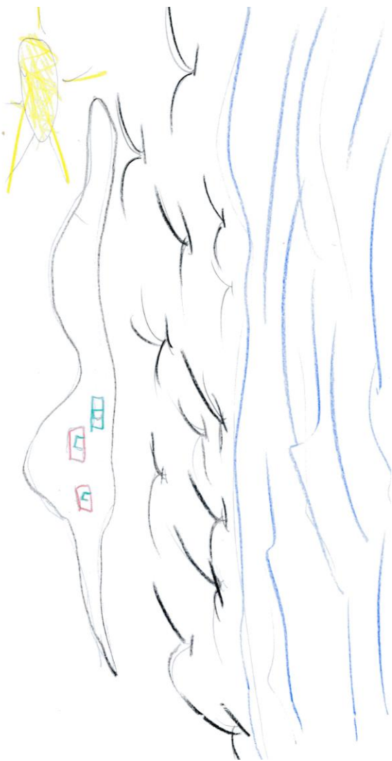
Disegno realizzato da Sara Giardino 3 a elementare

...in volo, prima di un raft o in attesa che il giorno volga al termine ..