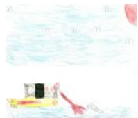
Lorenzo Errera, 1ª elementare